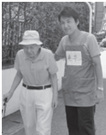
介護ボランティア中の ひとコマ

今回、目的外支出と認定されたのは、本来の視察目的と関係のないイギリス、ポーランド、韓国への海外視察などです。政務調査費は市民の皆様の税金です。税金での海外視察は廃止すべきです。また調査費の支出のチェック体制も厳しくすべきと思います。